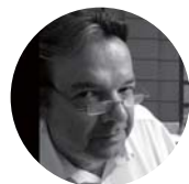
ウィル・アルソップ (Will Alsop)

1947年、イギリス生まれ。現在は、ロンドンを拠点に世界中で活躍する。「建築は社会変革と再生の手段であり、その象徴である」という信念に基づき国際的な舞台で活動。