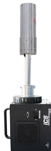
AMETEK社製統合型冷却システム ICS (Integrated Cryocooling System)