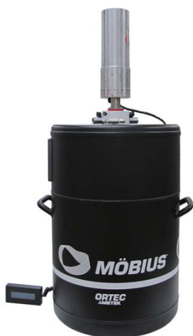
AMETEK社製液体窒素凝縮装置 MOBIUS Recycler