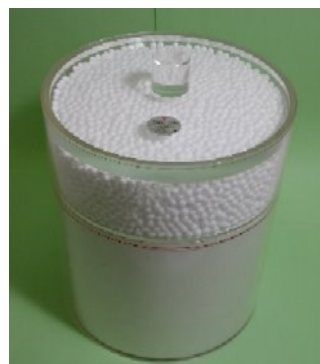
日本アイソトープ協会製 2Lマリネリ標準線源