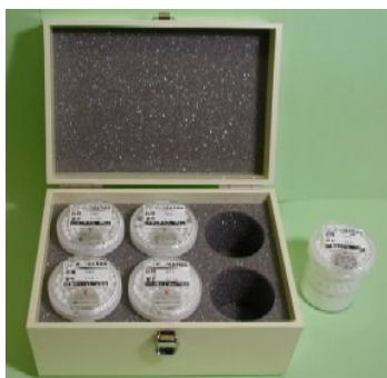
日本アイソトープ協会製 U8標準線源