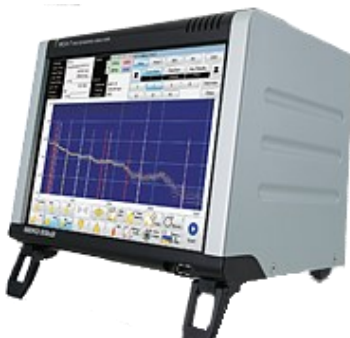
セイコー・イーザーアンドジー社製 MCA7a