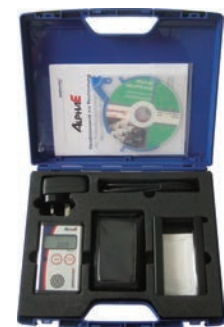
図. AlphaE本体とケース(オプション)

この製品は、SAPHYMO (Bertin) が製造し、セイコー・イーザーアンドジー株式会社が販売しています。