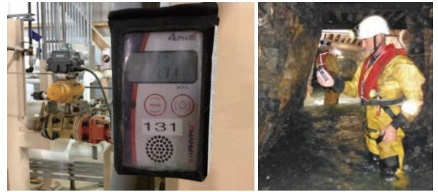
図. ラドン・エリアモニタ