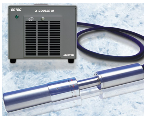
AMETEK社製電気冷却機 X-COOLER III