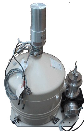
セイコー・イージーアンドジー社製 ハイブリッド冷却システム